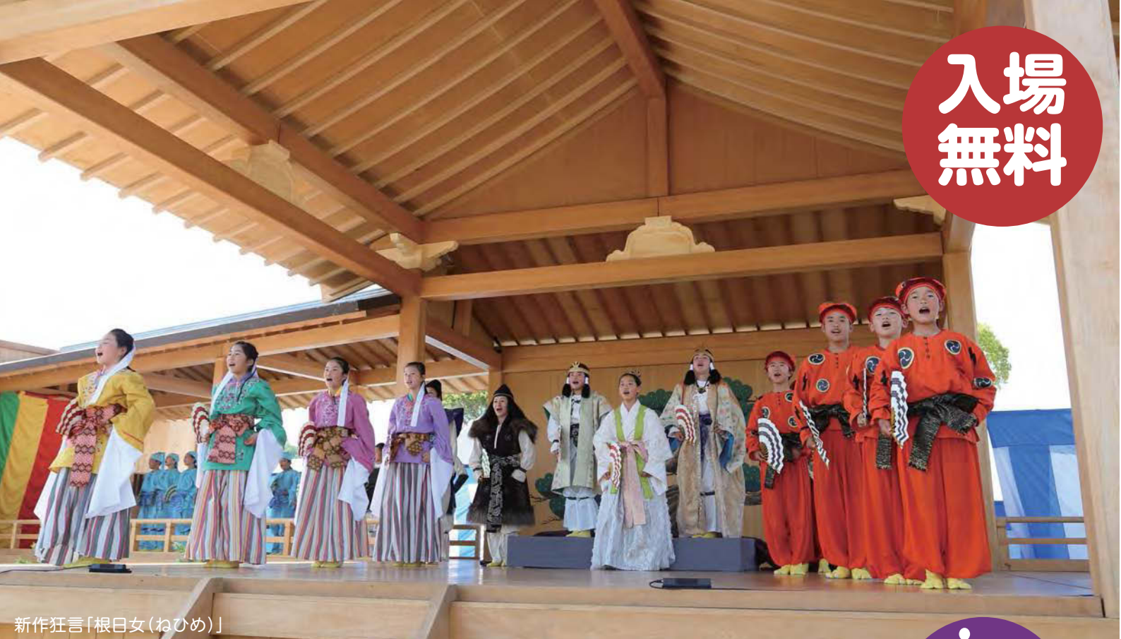
新作狂言「根日女(ねひめ)」